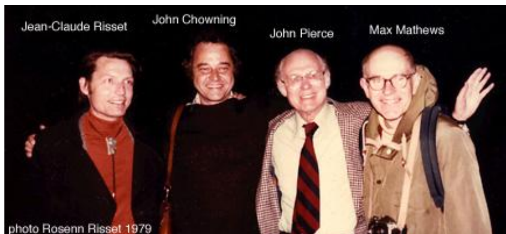
Les pionniers de la synthèse sonore et de l'informatique musicale